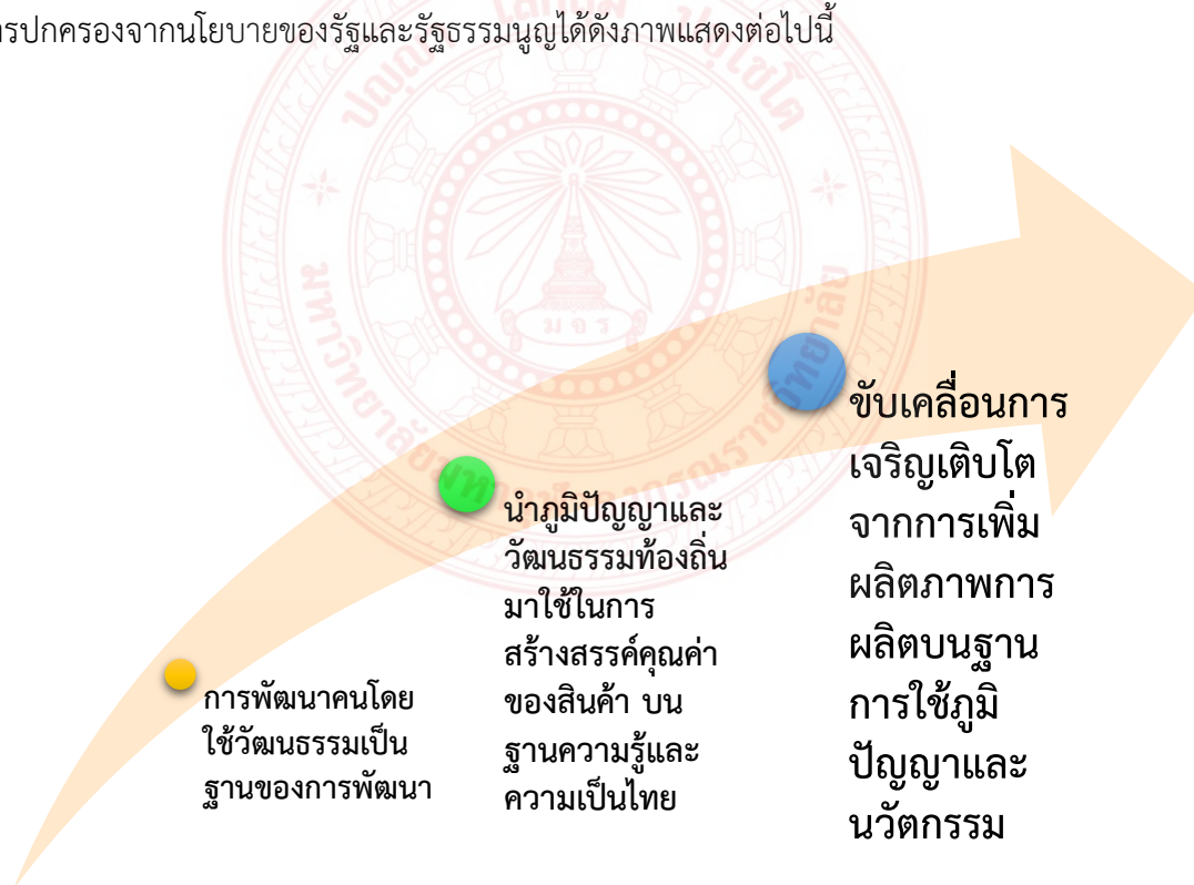
ภาพประกอบที่ ๔.๑ แสดงการเปลี่ยนแปลงและการคงอยู่ของวัฒนธรรมอีสานทางการเมืองการปกครองนโยบายของรัฐบาลและรัฐธรรมนูญ

เศรษฐกิจโลกได้อย่างมีประสิทธิภาพ แผนพัฒนา ฯ ฉบับที่ ๑๑ เน้นเรื่องการสร้างภูมิคุ้มกันในมิติต่าง ๆ เพื่อให้การพัฒนาประเทศสู่ความสมดุลและยั่งยืน โดยนำทุนของประเทศที่มีศักยภาพ มาใช้ประโยชน์อย่างบูรณาการและเกื้อกูลกัน พร้อมทั้งเสริมสร้างให้แข็งแกร่งเพื่อเป็นรากฐานการพัฒนาประเทศที่สำคัญได้แก่การเสริมสร้างทุนสังคม (ทุนมนุษย์ทุนสังคม ทุนทางวัฒนธรรม) การพัฒนาคน และสังคมไทยสู่สังคมคุณภาพ สร้างภูมิคุ้มกันตั้งแต่ระดับปัจเจก ครอบครัว และชุมชน สามารถจัดการความเสี่ยง และปรับตัวเข้ากับการเปลี่ยนแปลง และแผนพัฒนา ฯ ฉบับที่ ๑๒ เน้นพัฒนาให้ประเทศไทยมีความมั่นคง มั่งคั่ง ยั่งยืน เป็นประเทศพัฒนาแล้ว ด้วยการพัฒนาตามหลักปรัชญาของเศรษฐกิจพอเพียง หลักการเจริญเติบโตทางเศรษฐกิจที่ลดความเหลื่อมล้ำและขับเคลื่อนการเจริญเติบโตจากการเพิ่มผลิตภาพการผลิตบนฐานการใช้ภูมิปัญญาและนวัตกรรม ด้วยกระบวนการมีส่วนร่วม ทั้ง จากภาครัฐ เอกชน ประชาชน และภาคการศึกษา ในทุกพื้นที่ของประเทศ และจากผลการศึกษาสามารถแสดงให้เห็นถึงการเปลี่ยนแปลงและการคงอยู่ของวัฒนธรรมอีสานทางการเมืองการปกครองจากนโยบายของรัฐและรัฐธรรมนูญได้ดังภาพแสดงต่อไปนี้