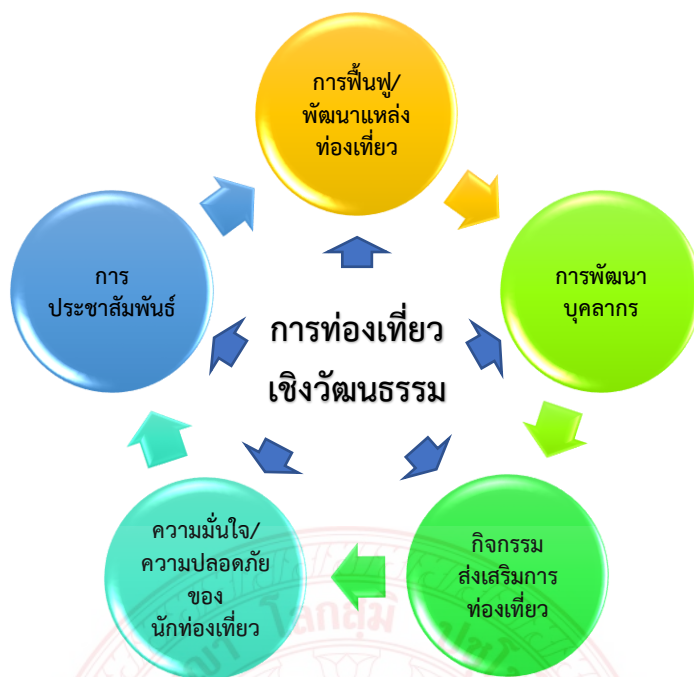
ภาพประกอบที่ ๔.๒ แสดงองค์ประกอบกิจกรรมการจัดการการทอ่งเทียวเชิงวัฒนธรรม